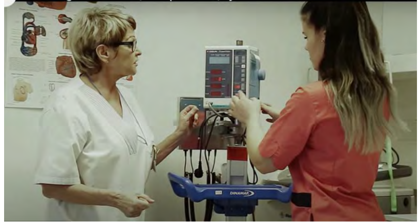
Från informationsvideo om sjukskötarutbildningen